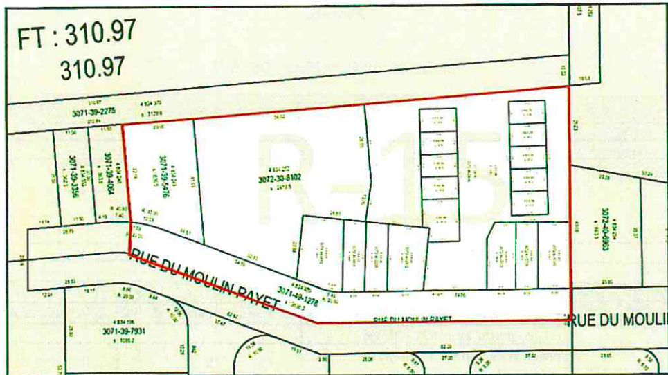
Délimitation de la zone R-15 avant modification